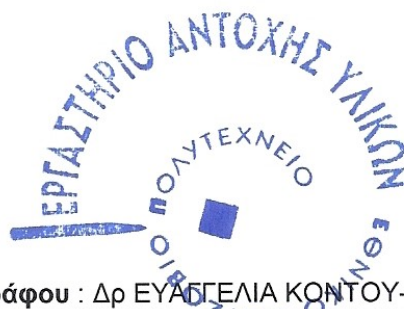
Δρ Β. ΒΑΔΑΛΟΥΚΑ

Υπεύθυνος Αναθεώρησης Εγγράφου : Δρ ΕΥΑΓΓΕΛΙΑ ΚΟΝΤΟΥ-ΔΡΟΥΓΚΑ